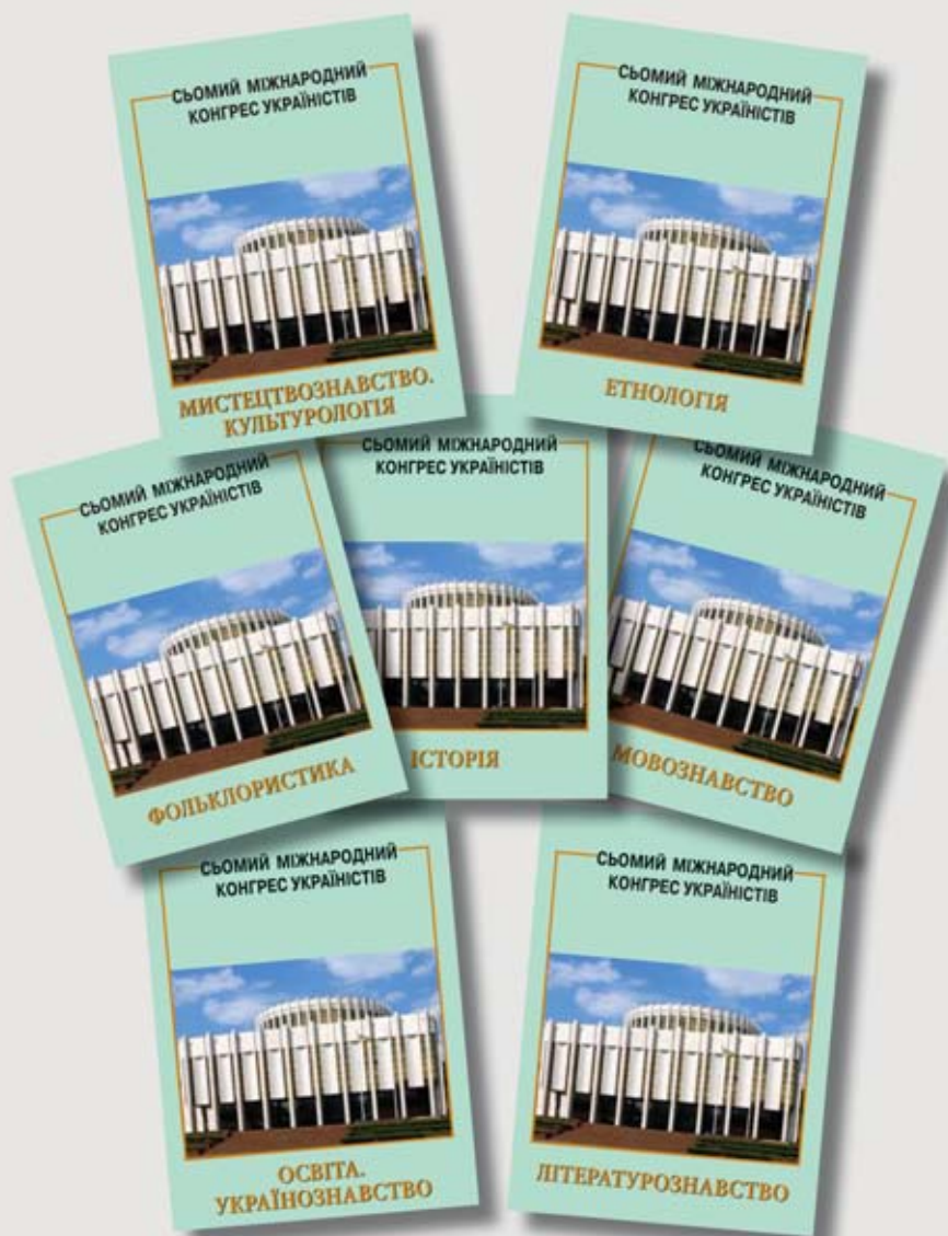
Матеріали Сьомого міжнародного конгресу українців