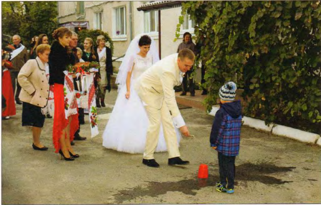
Місцевий звичай, коли зустрічні хлопчики переливають дорогу нареченим водою, наречений викуповує «вільний прохід» та переносить через символічний потік наречену. Вінницька область, смт Муровані Курилівці, 2015 р.