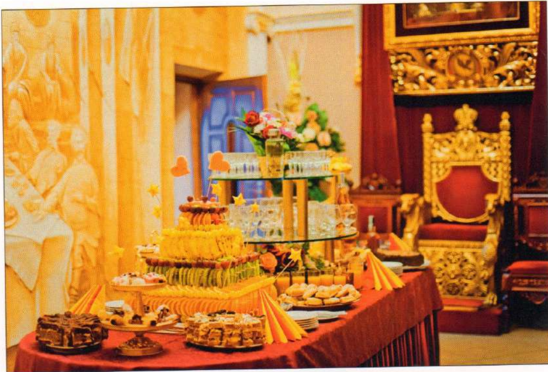
Кенді-бар для весільних гостей. Львів, 2013 р.