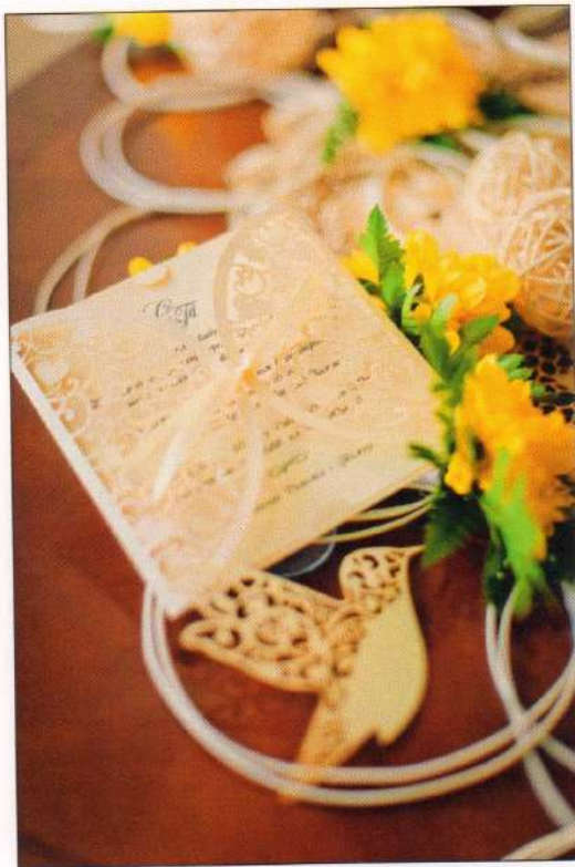
Авторська листівка-запрошення на весілля. Львів, 2013 р.