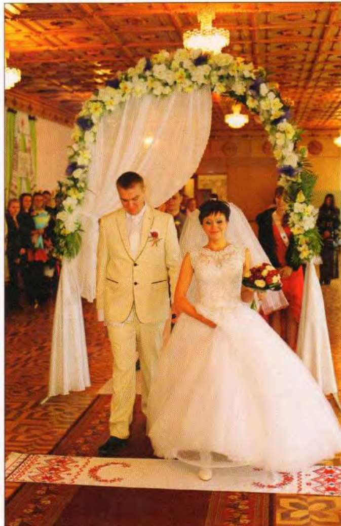
У РАЦСі наречена поспішає стати першою на рушник. Вінницька область, смт Муровані Курилівці, 2015 р.