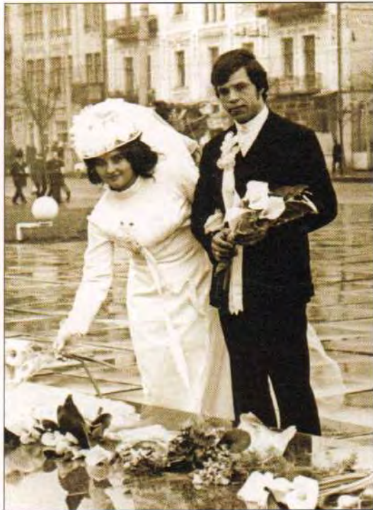
Покладання квітів до меморіалу «Вічний вогонь». Вінниця, 1972 р.