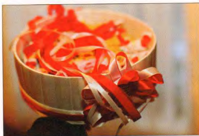
Весільне сито зі збіжжям, цукерками та грішми для обсіпання молодих. Вінницька область, смт Муровані Курилівці, 2015 р.