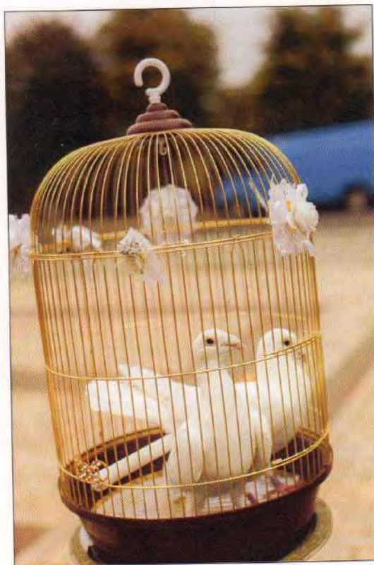
Пара голубів на весіллі як символ щасливого подружжя