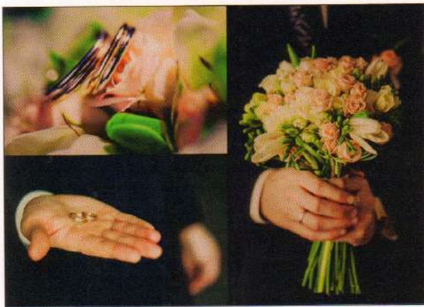
Весільні атрибути на сучасному весіллі (обручки та букет). Київ, 2012 р. (фото із сімейного альбому Микитчуків Ольги та Сергія)