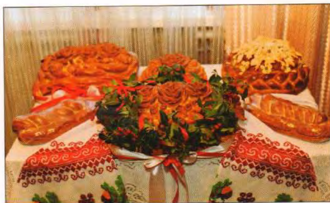
Весільний коровай, хліб та «гуски» для обряду покривання. Вінницька область, смт Муровані Курилівці, 2015 р.