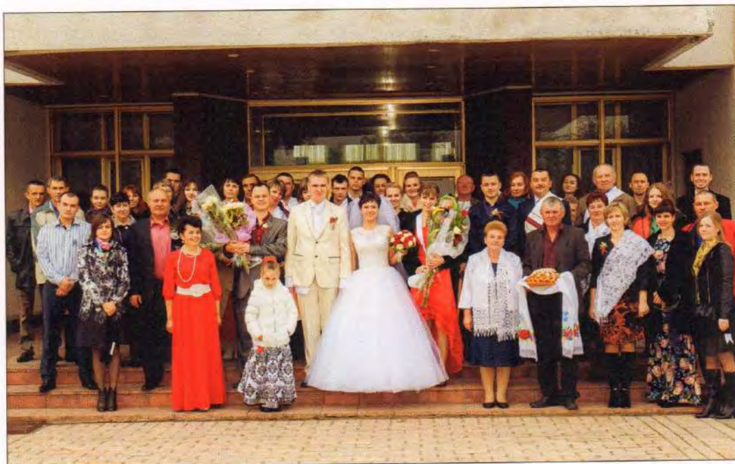
Загальне весільне фото наречених з родиною та друзями. Вінницька область, смт Муровані Курилівці, 2015 р.