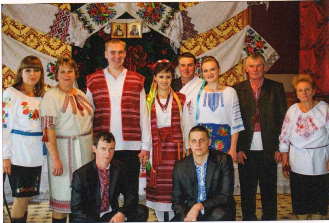
Стилізований формат етновесілля. Житомирська область, Коростенський р-н, с. Бехи, 2015 р.