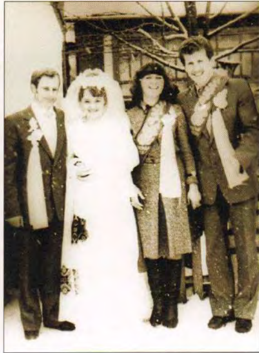
Наречені зі свідками. Вінницька область, м. Липовець, 1985 р.